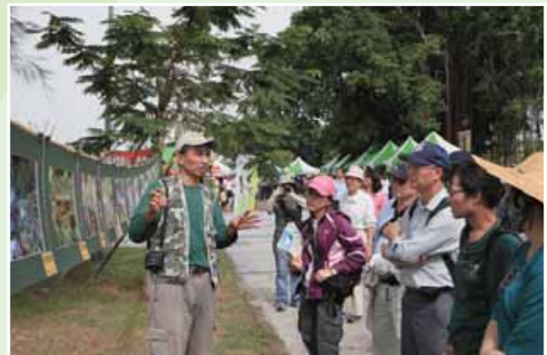
每年的生態季都會在生態攝影展的攤位看到他講解的身影