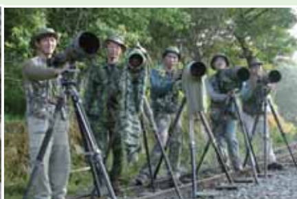
2004年5月，阿里山的回憶