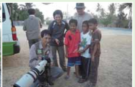
即使在國外，仍在熱心推廣生態教育喔！