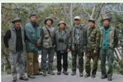
2005年元旦，多納拍河鳥，難得的合影