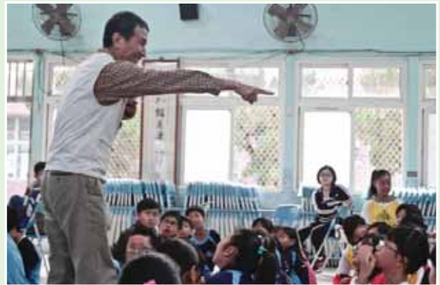
協助鳥會到學校宣導草鴉生態保育

最近的一次合作是2015年的鳥松濕地語音導覽網站，當我詢問是否能請他為鳥松濕地的網頁製作團隊錄製鳥類導覽解說的語音時，他不只應允，還耐心十足又認真的準備，並約幾個星期的晚上時光，與我在校討論鳥類觀察的細節，確認錄製的方向後，隨即拿著他個人筆電開啓鳥類檔案，一隻、一隻鳥，慢慢的協助製作鳥松濕地的鳥類介紹語音解說，完成後還一一再確認，有錯一定再次錄製，沒有絲毫的不耐煩，認真又執著的態度，相信在您聽到鳥松濕地的鳥類導覽解說語音時，一定很有感覺。錄製後期，泡茶聊天，現今回想起，那時大哥身體已有些許的狀況，但他並沒有因為狀況差而斷了承諾，對此，我真的相當的不捨，也萬萬沒想到12月3日20：00後，這些作品已成為大哥的遺作。