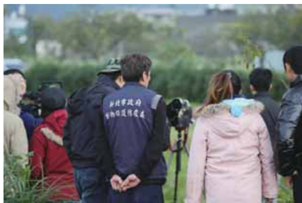
這次事件新北市政府與基金會合作明快的處置贏得許多掌聲

待清水濕地重回一百年前，那個探險家看到一萬隻鳥的感動，期待從產業切入的金山倡議，會是台灣經驗另一個重要的里程碑。