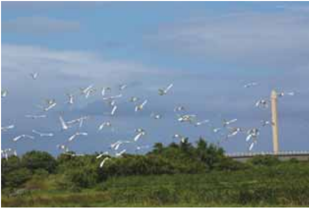
清水濕地是候鳥的重要棲地

感動，而淚流滿面；一百年後，一萬個人在這裡，看一隻鳥失去了棲地，而淚流滿面。這樣的場景，不是我們希望的畫面；小白鶴事件清楚的讓我們省思幾個重要的議題：我們對於濕地的政策是什麼？私地若劃入保護區範圍權益如何配套？小白鶴棲息的農地地主的權益如何保障？友善的產業發展是不是也可以是保護區外的保護區？鳥友們看鳥拍鳥之餘，能否也能愛鳥及屋，看到棲地的重要與農民的生計？