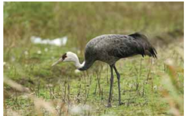
曾經出現在金山清水濕地的白頭鶴