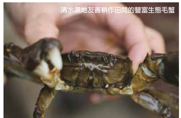
清水濕地友善耕作田間的豐富生態毛蟹