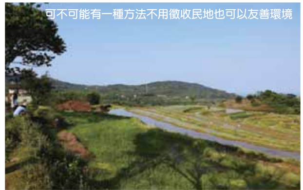
可不可能有一種方法不用徵收民地也可以友善環境

基金會經營八煙聚落，讓我們很清楚的知道台灣農業的困境，也立志要推動聯合國「里山倡議」的在地版本－「金山倡議」，期待以創新加值的友善產業，提升農民的收入，再透過與當地小學的合作，將保價收購的新鮮農