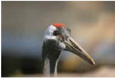
2008年金山丹頂鶴事件造成地方的分裂

境，使得大批的鸕鶿科與雁鴨科冬候鳥，毫無落腳與棲息之處，只能勉強在磺溪流域灘地棲息。