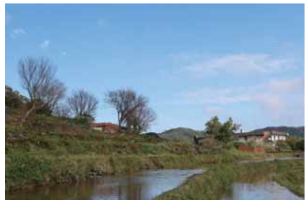
友善環境的水田濕地是候鳥最棒的棲地