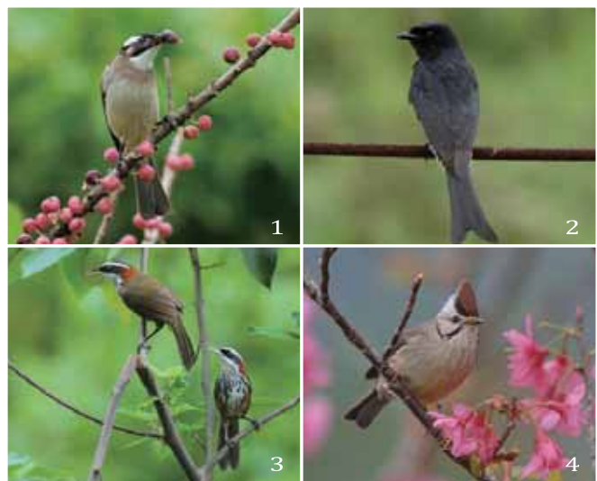
圖1.白頭翁。圖2.大卷尾。圖3.小彎嘴。圖4.冠羽畫眉。

在16個樣區中，茄荳樣區一直以來都是鳥種數及總數量最多的樣區，今年鳥種78種、總數量17,651隻次都是最多的，且超出其他樣區很多。茲將2014-2016年來均有調查記錄之13處樣區，依鳥種數及鳥類總數量消長情形做成圖一及圖二，其中茄荳濕地因為鳥類總數量與其他