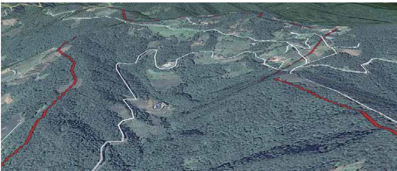
此空照圖為乾溪，是坪林北勢溪上游的小集水區之一，該集水區共八戶茶農，其中四戶為有機茶農，透過PPGIS工作坊的運作後，可以得知非環境友善(非有機)茶園分布，並透過茶農間的社會關係培力，讓更多的茶農參加環境友善茶的生產，讓乾溪集水區內的茶園皆沒有農藥。

棲地圈護 棲地圈護部分，是臺灣藍鵲茶的指標關鍵，也就是所謂的「集水區規劃式製作」。今坪林的環境友善茶園（包含有機茶園）約佔茶園總面積的3.46%，地景護育的推動，必然期待坪林100%為環境友善農法