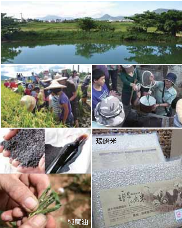
社區舉辦割稻工作假期、有機稻作遊程以及生產無毒農產品