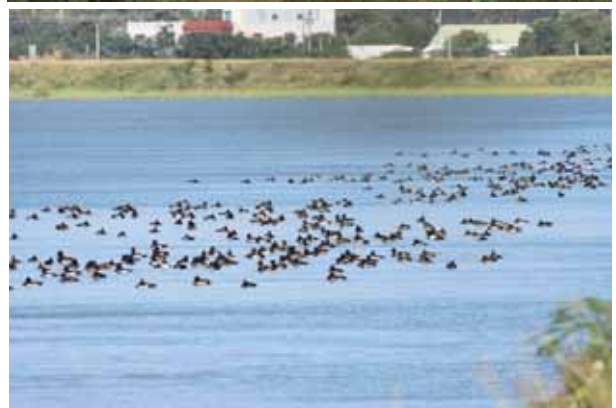
龍鑾潭區的雁鴨