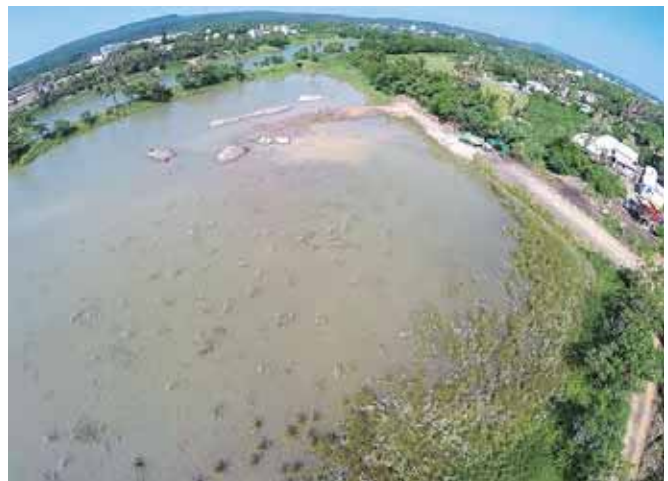
草潭濕地營造(空拍圖)

未來的工作重點包括「濕地棲地環境」：東堤岸改善、水位調節、環境監控、外來種清除防護、濕地生態廊道建構及復育、周邊衝擊排除與減輕。「教育宣導」：強化濕地環境教育、社區保育教室推動、生態人文資料整合轉化。「獎勵輔導」：協助農田生態管理推動、協助建立產銷及認證。