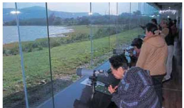
在自然中心內賞鳥的民眾