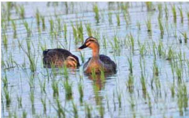
上圖：遭雁鴨蹂躪的水田。下圖：水田裡的雁鴨。