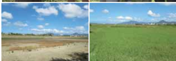
西北角乾裂的農田