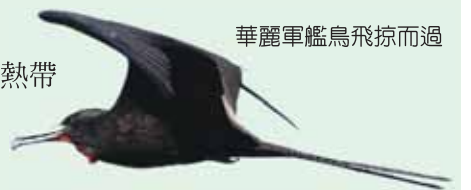
華麗軍艦鳥飛掠而過