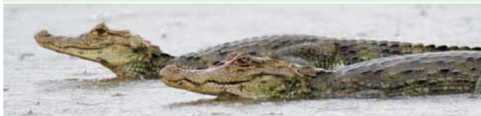
雨中，眼鏡凱門鱷spectacled caiman依然淡定