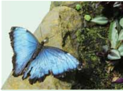
雖已殘翅，摩兒蝶的美麗藍光依舊