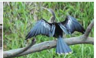
完美展翅的美洲蛇鵜