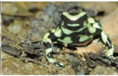
黑綠色系的箭毒蛙