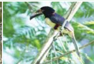
黑喉美洲咬鵑僅見一次