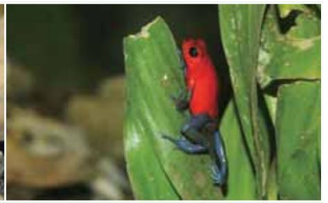
草莓箭毒蛙有很炫的色彩