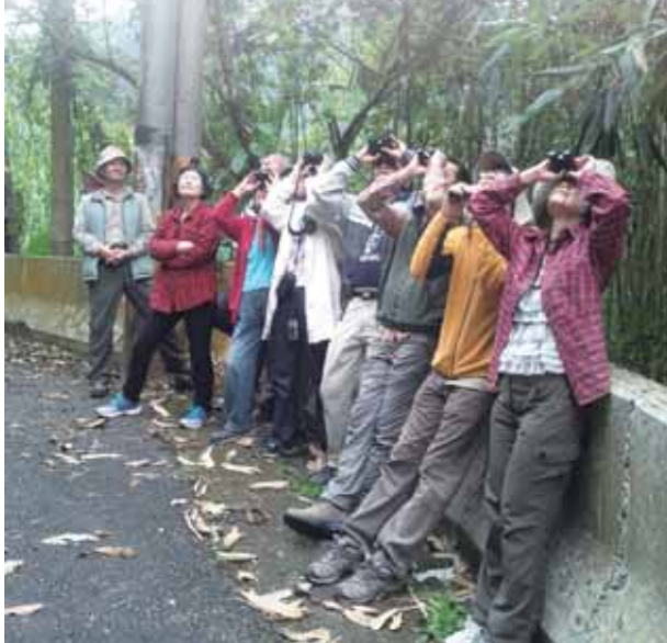
不知是人賞鳥還是鳥賞人，彼此相看百不膩

這裡地名稱爲頂笨仔，應是原住民稱呼之音譯，據劉大哥說，這裡的人跟野生動物都是笨笨的，全是因住在頂笨仔之故。就說他自己好了，因爲從小幫忙農耕，所以當兵的時候對於長官交代的事不以爲苦，就不會偷雞摸狗，因而被同袍