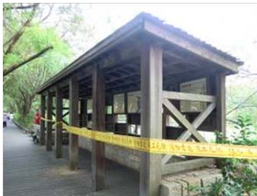
破損嚴重的賞鳥牆已禁止民眾進入