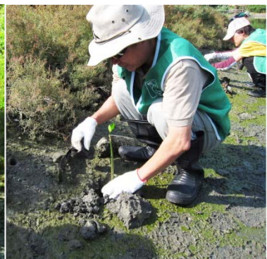
中都濕地志工於園區水岸邊種植紅海欖胎生苗