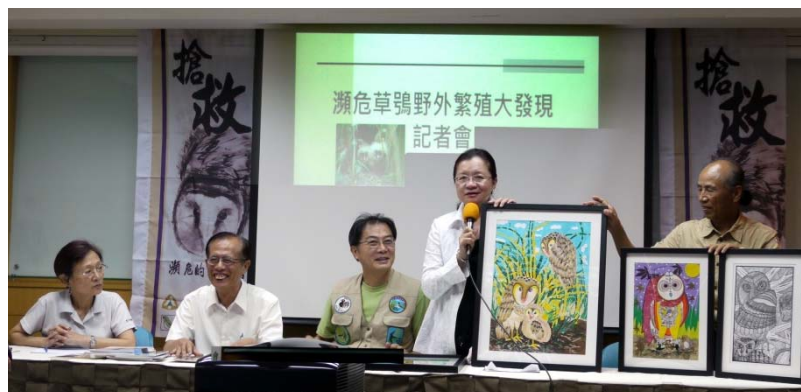
「瀕危草鴉野外繁殖大發現」表記者會，也公布草鴉繪圖得獎作品展開幕的消息。

2.7/24 出席南星計畫遊艇專區環評審查，會中結論：保留北邊防風林之外，補植中林路以北範圍為防風林區，完整面積約 5.7 公頃。8/16 也與海洋局談南星遊艇專區防風林保護。