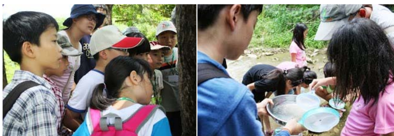
↑小小法布爾探索趣於保力林場進行兩天一夜的生態觀察課程

5.8/09-15 馬祖賞鷗卡蹻行，近一星期的活動踏遍馬祖東引、南竿、北竿、東莒、西莒及芹壁各島，囊括歷史人文到生態