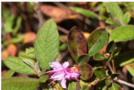
左：金毛杜鵑；右：南澳(埔里)杜鵑

脈顯著，花絲被毛則為野山椒。右叉路指示牌至樂樂谷，有野溪溫泉，為易崩路線，岔路海拔 1525 公尺，丈量樹皮呈白雲狀的阿里山千金榆，胸寬 210 公分、株高 17 公尺，伴隨九芎、化香樹、朴樹、銳葉紫珠、枇杷(人為栽種)、山葛、五節芒、白匏子、阿里山宿柱苔。