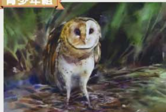
金牌 黃于亨 (台北市) 繪畫主題：怯 作品敘述：在人類過度破壞環境的影響下，我們應該要努力防止牠們的棲地被污染，避免牠們消失。