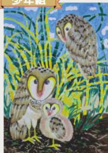
金牌 張凱婷 (台中市) 繪畫主題：草鴞一家人 作品敘述：剛出生的草鴞實實好可愛，大家都要保護草鴞，才能看到可愛的草鴞一家人囉！