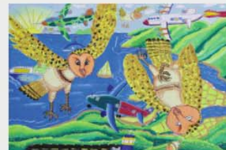
銅牌 施純煒 (台中市) 繪畫主題：隕落的草鴞 作品敘述：人類的飛安固然重要，但是也不能忽視這些好朋友～草鴞，讓我們一起來保護牠們吧！