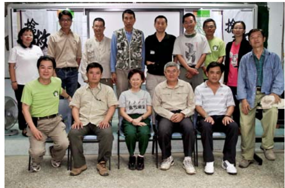
↑ 第二次「草鴉保育行動平台專家座談會」於大洲國中舉行

鳥會於 9 月在臉書成立「挽救瀕危的猴面鷹」粉絲專業，透過網路將各項訊息告知給更多民眾。