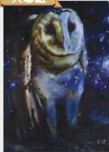
金牌 詹莊軒 (新竹市) 繪畫主題：星空下的草鴞 作品敘述：晝伏夜出的草鴞總是在星空下活動，身上的斑點有如星空般的美麗、也有如星空般的神秘，因此決定用星空此一意象。