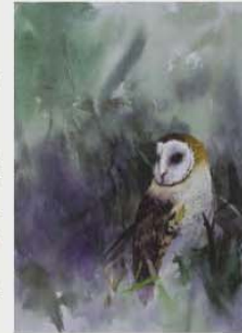
銅牌 林士傑 (新北市) 繪畫主題：夜夢 作品敘述：在荒林中遇見了美麗的草鴞，就如同在深夜中睡床上的甜美好夢