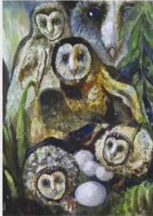
銀牌 蘇玲玉 (嘉義市) 繪畫主題：讓我們一起保育草鴞 作品敘述：藉此我對草鴞多了很多認識，瞭解草鴞的生態、故事。草鴞是台灣生態中多麼重要稀有的動物，所以讓我們一起保育牠們吧！