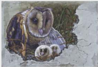
銀牌 江駿杰 (新北市) 繪畫主題：僅存的樂土 作品敘述：時代進步，都市建設不斷拓展的同時，許多野生動物棲息地遭受到破壞，面臨瀕臨絕種的困境，如何在建設與維護生態環境間取得平衡，需要大家一起來審思。