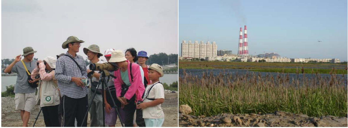
茄苳濕地

預期的榮景並沒有出現，原本豐富的生物環境卻起了很大的變化，當政者在努力的改善地方之時卻欲破壞濕地的生態面貌；感謝高雄鳥會一路來的支持以及地球公民協會、台灣濕地保護聯盟理事長翁義聰教授、台南市野鳥學會的相挺與襄助，還有政府相關單位的支持和其他幫忙過茄苳濕地的朋友，讓茄苳濕地的保存得到一線希望。對於自然環境採取趕盡殺絕的方式，以人造的環境完全取代，最終的受害者仍是人們本身。保留自然的物種與物類，在未來中或許有研究的價值，受益的仍是人類本身；比如疾病的治療或預防、植物抗病基因的改善等等。