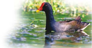
文／吳崇祥 · 圖／王健得(紅冠水雞)

只要有空，我總愛到鳥松濕地走走，看看花草、聽聽鳥叫，或低頭探訪草叢裡的小精靈：不論是晶瑩剔透的金花蟲、淑女般的小瓢蟲、美豔的蝴蝶，都讓我驚喜萬分，定會拿起相機為牠們留下美麗的身影，感謝鳥松濕地提供我休閒好去處，充實了我的生活，也從中獲得很多知識，進而了解濕地的功能、生態的平衡、環保的重要，特此為文祝頌鳥松濕地公園生日快樂。