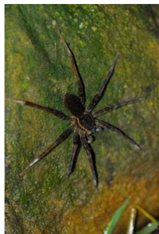
雄的溪狡蛛，會潛水