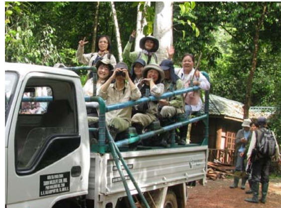
乘坐改裝過的卡車出發賞鳥囉！ 生動物和可愛的夜行性鳥類之外，望向天空更可欣賞滿天的星斗……。

「夜探」是踏續最特別的事，大夥兒坐上改裝過的卡車，鳥導站在最前方，手拿探照燈，非常認真的尋覓，只要車一停、跟著探照燈的方向看去，必定有精采的收穫，我們曾經有一個晚上看到 8 隻褐林鴉的記錄，當燈照向牠時，褐林鴉先是瞪著眼睛看著，然後把頭瞬間轉向後方，鳥導學牠的聲音呼叫，褐林鴉會瞬間再把頭轉回來，然後一會又轉向後方，就這樣重複幾次後，牠會發現有異而飛離，真好玩！而夜探除了看野