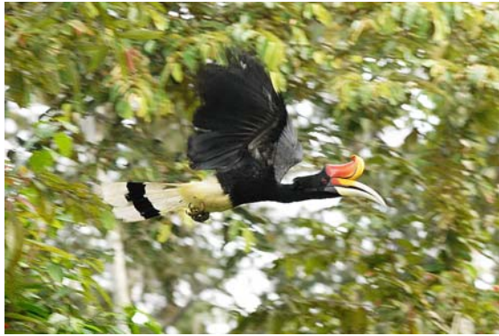
馬來犀鳥

離開踏續野生動物保護區後，有 2 天的時間是住在京那巴當岸（Kinabatangan）河邊的度假村，由於之前 2 星期下過大雨，水淹非常嚴重，致使動物大量遷移，所以 2 天坐船沿著京那巴當岸河觀景的過程，只看到栗鳶、灰頭魚鵬、褐冠鵝隼、蛇鵝、暴風鵝、犀鳥等在空中翱翔；兩次看到翡翠都是驚鴻一瞥，匆匆亮相，非常可惜。