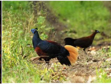
鳳冠火背鸛