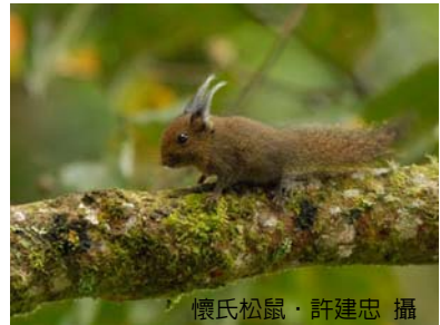
懷氏松鼠

步道邊走邊賞鳥，或上瞭望台、或走鋼構索橋，林梢野鳥、樹棲動物（紅毛猩猩、松鼠…等）之行蹤盡收眼底，印象最深的是看到白腹黑啄木，漂亮的紅頭很顯眼，40-48 公分，一次看到 2 隻飛行版，另一次看到牠辛勤的啄木、工作，非常可愛。