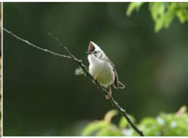
冠羽畫眉