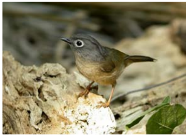
繡眼畫眉