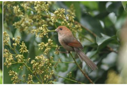
粉紅鸚嘴