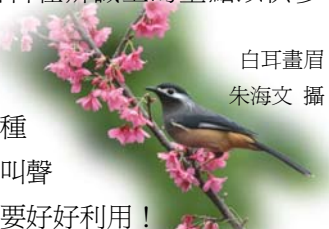
白耳畫眉

以下整理了畫眉科在辨識上的重點以供參考，雖然有些鳥習慣活動於草叢中，需仔細觀察、辨別，但各種畫眉外型容易辨識，叫聲也是很好的輔助，可要好好利用！