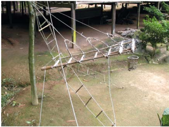
↑ 模型---黑燕洞的攀登採集工具