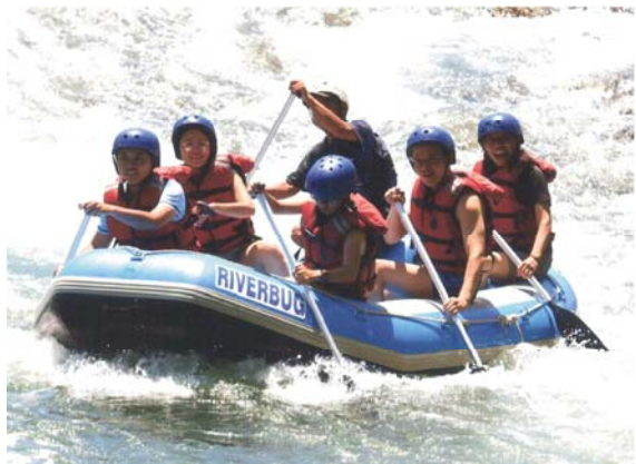
↑ 泛舟體驗(掃描自購買的照片)

平緩的行程因為“海盜船”的出沒，而顯得緊張有趣，錯身而過的膠筏，會在玩心大發的誘使下，彼此以槳波弄水珠濺濕衣物，甚至別船的 guide 會伸出魔手，提起遊客的救生衣，將人丟入水中享受清涼。面對這令人錯愕的一幕，我們開始死命的抵坐在筏內，不讓 guide 有機可趁。當然，他們也不會如此莽撞，會根據遊客的反應決