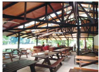
簡單的格局，buffet 填飽我們

梳洗完畢，簡單的 buffet 填飽我們的飢餓感。神奇的是，電視中放映著我們幾個團體剛剛泛舟的動態畫面。工作人員的神速不僅秀出了 MOV 檔，連個別橡皮筏的泛舟英姿也在電腦螢幕中重覆播放，只要我們有興趣，提供