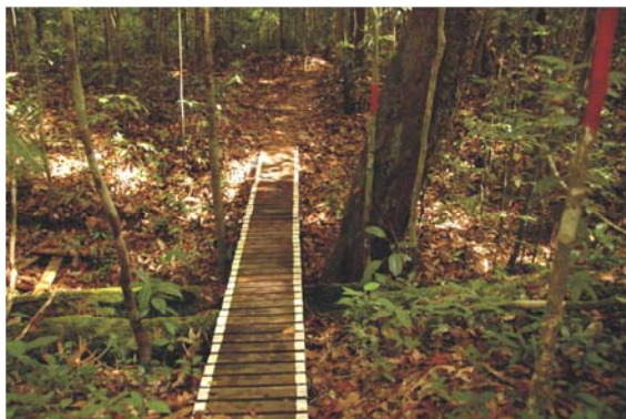
↑紅漆顯示路徑 ↓步道中迷人的蘭花

河與海的交會地帶，滿是紅樹林植物，高大的支柱根如八爪魚一般的抓緊土壤，捍衛著土地。彈塗魚、鱷魚、水鳥一起享用這片濕生環境，在規劃良好的步道上，尚可觀看胎生的水筆仔及上樹的相手蟹。9 條任君挑選的步道，最長 10 公里，只要看著樹幹上的紅漆，加上簡單的路標，讓人在用心觀察之餘不需特別花心思辨識路徑。