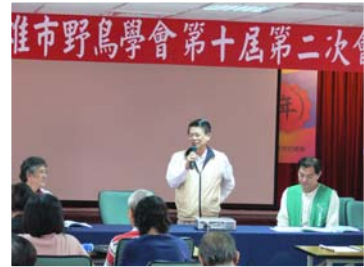
感謝公平會湯金全主委蒞臨會員大會

邀請鳥類生態攝影者王徵吉老師介紹「黑琵世界全記錄」，與鳥友分享王老師多年來追蹤黑面琵鷺的過程與驚喜的發現。