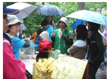
向民眾解說蔓澤蘭對本土生態的影響