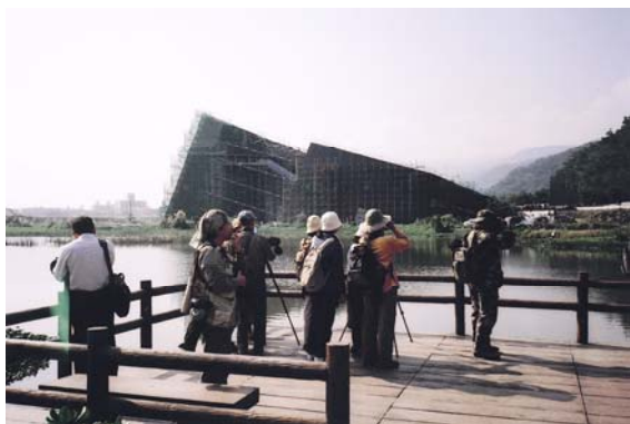
↑ 烏石港遊客中心後方水塘

次晨天沒亮已抵達五峰旗瀑布，在微光中的天主教堂屋簷上，已見一隻紫嘯鶇（牠沒有騎自行車，卻發出煞車聲），天剛亮時，台灣藍鵲小群就開始活動，飛到路邊的低矮樹叢上覓食果實而不太怕人，其他如樹鵲、白耳畫眉、大彎嘴、鉛