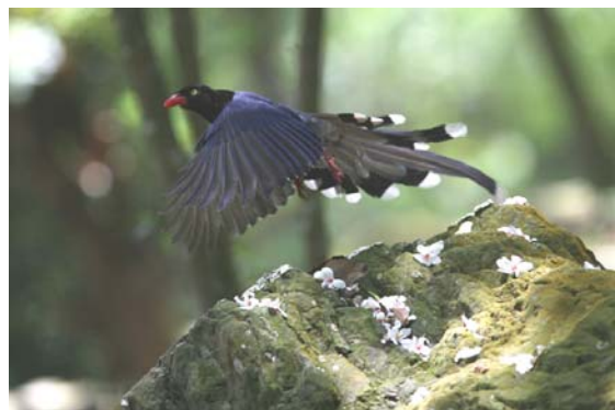
從桐花岩石起飛的台灣藍鵲 ↑

五公廟前面及附近種植了不少廣東油桐，每年桐花開時最美了，像去年桐花盛開，一片白花鋪地，置身其間，真是舒服。今年桐花開得比較零散，且上山賞花的遊客暴增，包括自行車族，感覺就變差了。就在桐花開的時節，也是台灣藍鵲的繁殖期，而每年台灣藍鵲都會在五公廟附近築巢繁殖，當台灣藍鵲停在桐花繽紛的岩石上，感覺真美！是拍攝牠們的最佳時機。只是擔心遊客的增加會對牠們的繁衍形成莫大壓力而離開，網路消息還說此林道將全面鋪設柏油，果真如此，生態也自然會遭到某種程度的破壞，台灣藍鵲還會不會留在此處繁殖，就難以預料了！