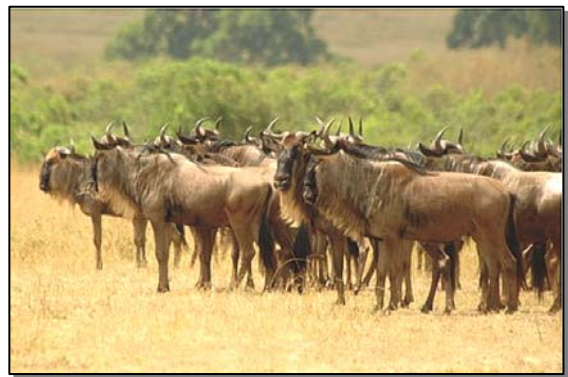
↑ 機警的面對危險的牛羚群

園、國家保護區或是私人動物保護區，太過分散且孤立，甚至分屬於不同的國家，應該要建立聯繫的生態廊道，串聯這些不相連的區塊，以協助生物覓食、求偶與擴散，這將有助於有效族群的維持。肯亞也許夠寬、夠廣，動物種類、數量也多，但是保護區卻只佔 7% 左右，大部分的動物依然生活在保護區之外，偷獵、盜賣野生動物皮、毛、肉、牙的事件依舊可聞，嚴重影響生物族群的穩定。面對全球性的生物多樣性流失，各國希望健全的生態旅遊能帶來一片生機；在動物資源豐富的非洲，南非、納米比亞等國…也相繼進入生態旅遊的市場，真希望肯亞政府能與其他非洲各國建立起保育的聯絡網路，讓其間活動的動物能擁有更大廣闊的空間；否則，孤立的生態環境，將會是物種的黃泉之路！