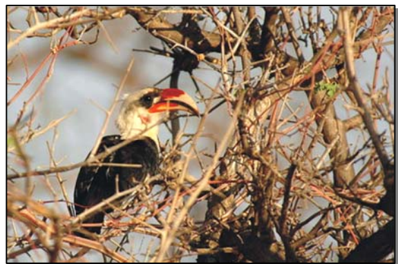
紅嘴犀鳥在午休時候拜訪

炎熱的午後，不是 safari 的良機，紅嘴犀鳥在後園鳴叫，當我低頭看書時飛掠而過，黑白色調